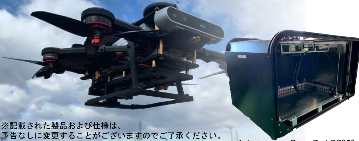
Autonomous DronePort DP250